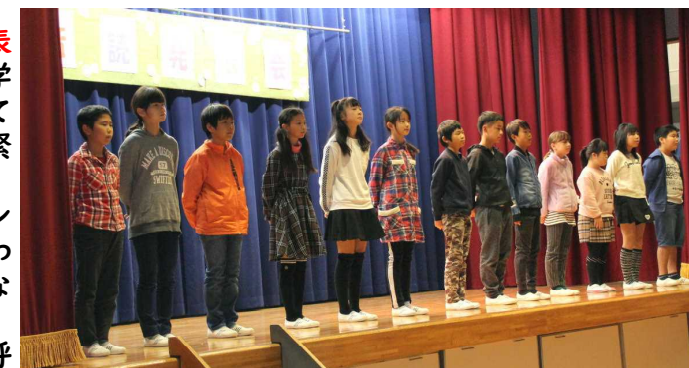
6年生音読発表 落語に挑戦