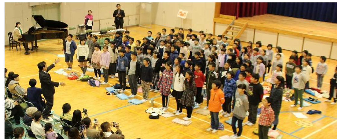
全校児童による合唱「音楽のおくりもの」