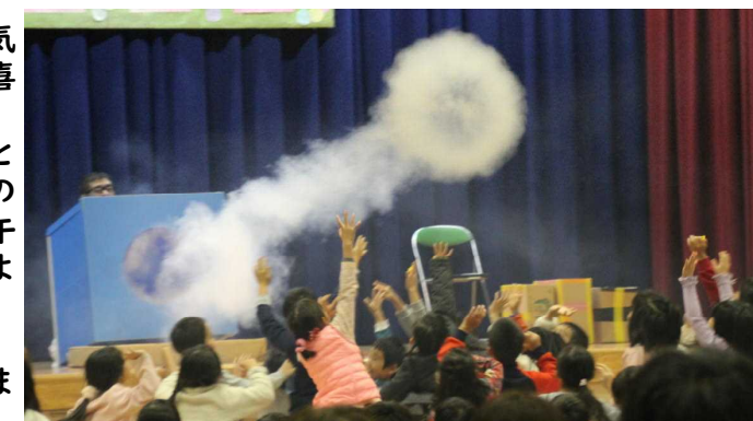
はてな先生によるサイエンスショー