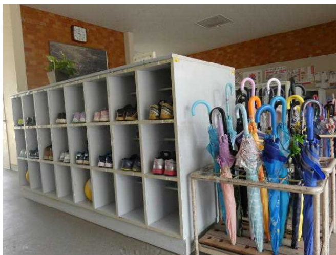
そろったくつばこと傘立て(10月24日)

このことは、何年も前から本校の教職員一同、一致して指導してきたことでもあります。この原稿を書いている今日はたまたま雨が降っていたので、思い立って、靴箱を見に行きました。すると、靴箱の縁にかかとをそろえてくつを置くと指導していたことが見事に守られている学年がありました。縁にかかところがそろってなくても、靴はどの学年もきちんとそろえて並べられていて、たいへんうれしい気持ちになりました。そして、傘も、ただすぼめて立てるのではなく、きちんと巻いてきれいに並べられていました。中には巻かれていない傘もありましたが、