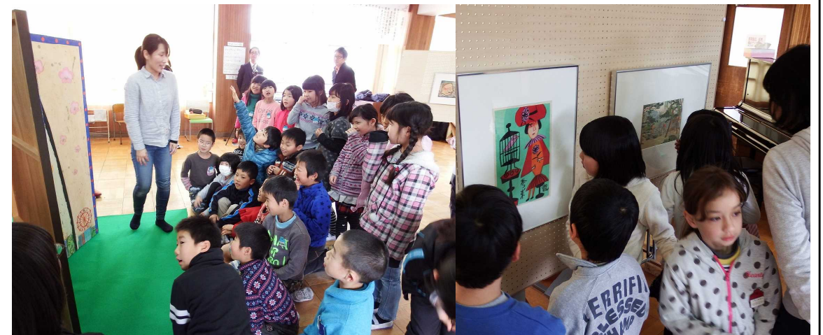
昨年度のコレクションキャラバンの様子

今年度は全学年で実施します。また、5.6年生には、鑑賞した作品に描かれているモチーフなどをテーマに児童が描画し、完成後に作品と合わせて描いた作品を発表するというワークショップも予定しています。