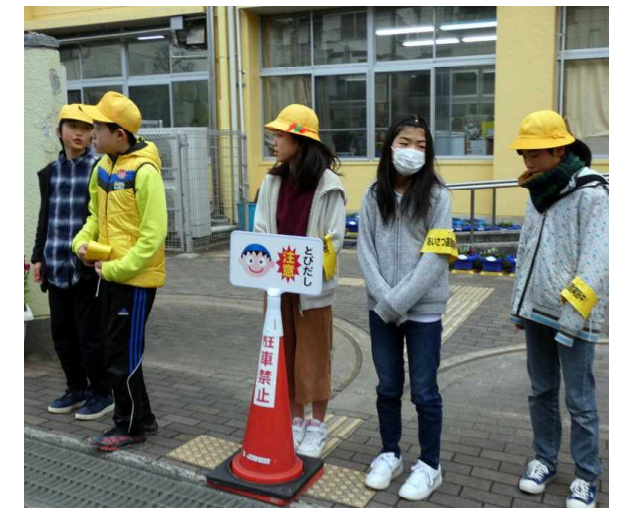
1月22日 あいさつ運動