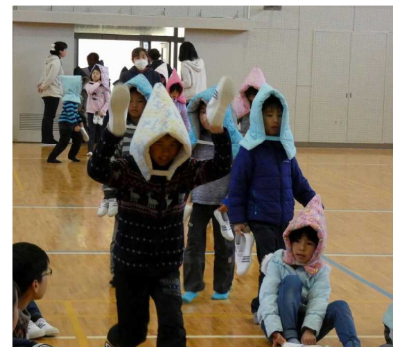
1月17日 地震緊急避難訓練