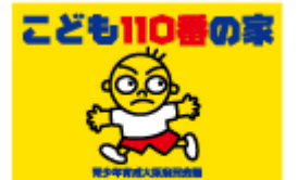
「子ども110番の家」の旗