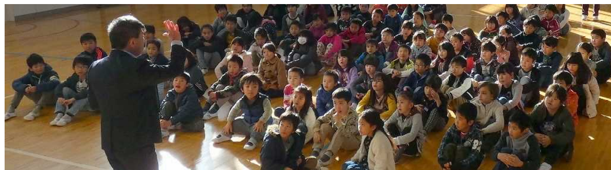
朝礼で話をしっかりと聞いている子供たち

今年から新しく指導の徹底についての共有をしたことには、「階段・廊下の右側歩行」です。階段や廊下には夏休みにペンキで矢印を書き込み、子供たちにわかりやすい工夫をしました。すべての教職員が同じ目線で子供たちに接し、指導していくことで、子供たちの中に根付いていくものだと考えています。教師によって、指導がぶれないように努力をしています。