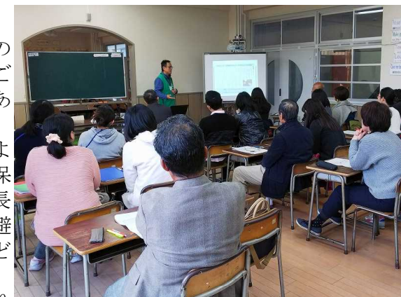
防災士による講演会