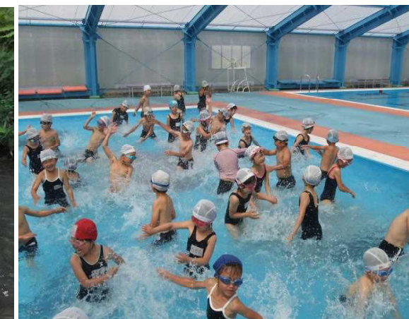
水泳指導(B&G海洋センター)