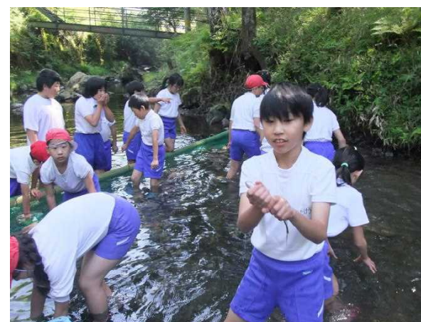
林間学舎(マスカミ 天川村)

なお、8月の引き落としはなく9月11日に8月分・9月分の2ヶ月分を引き落とします。(8月の給食費はありません。)