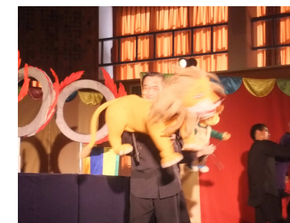
11/11 人形劇 鑑賞会