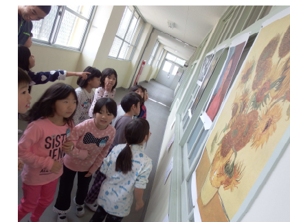
11/13 長休みの「図工タイム」