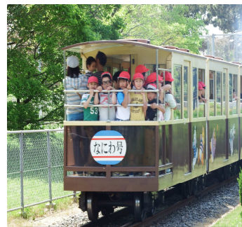
全校ふれあい遠足(4/30)