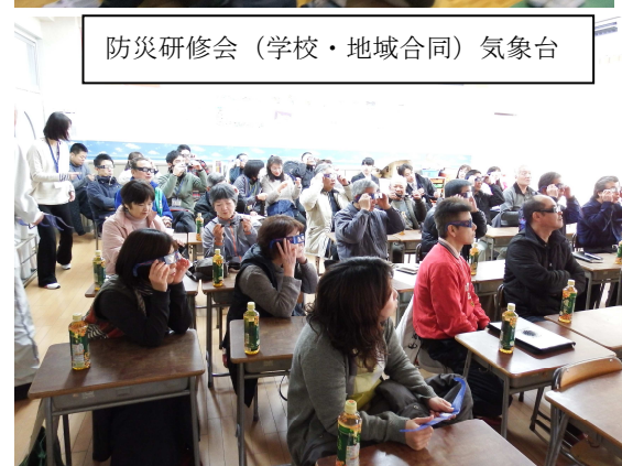
防災研修会(学校・地域合同) 气象台