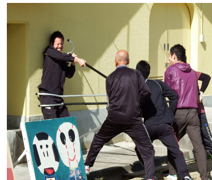
11月11日 不審者侵入対応訓練

また、学校周辺での公園では、セアカゴケグモの発見情報もいただいております。各ご家庭でも、登下校時・放課後等、被害に遭わないように、お気を付けいただければ幸いです。