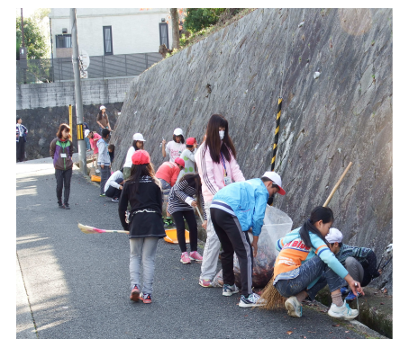
11月11日・18日 落ち葉清掃