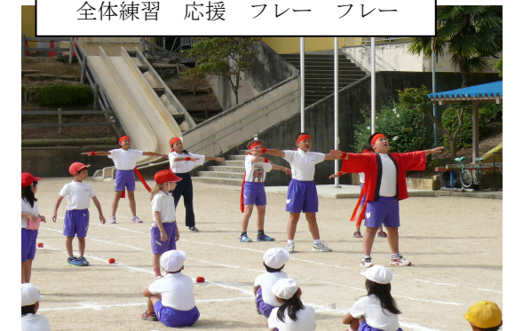
全体練習 応援 フレー フレー