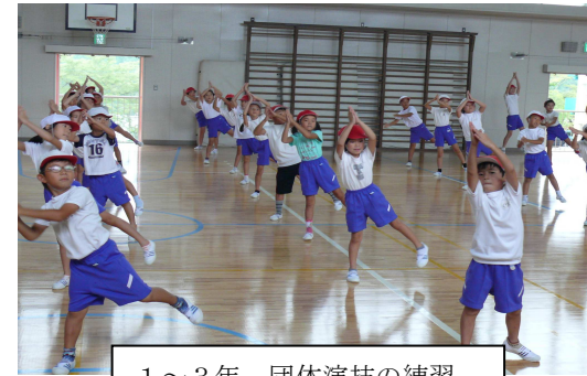
1~3年 団体演技の練習