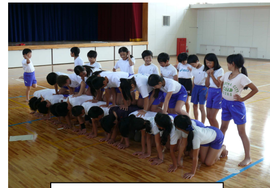
4~6年 団体演技の練習