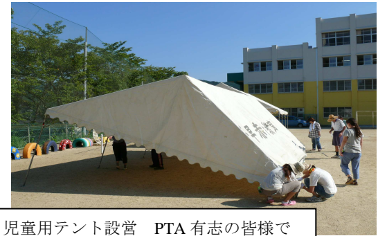
児童用テント設営 PTA有志の皆様で