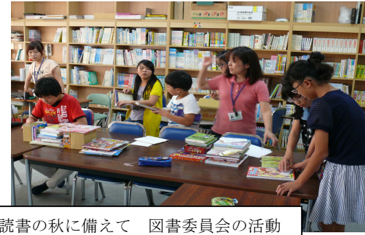
読書の秋に備えて 図書委員会の活動