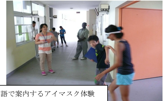
英語で案内するアイマスク体験