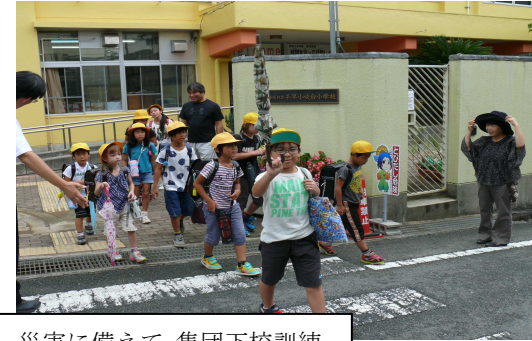
災害に備えて 集団下校訓練