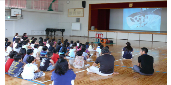
平和学習会 「ウミガメと少年」鑑賞会