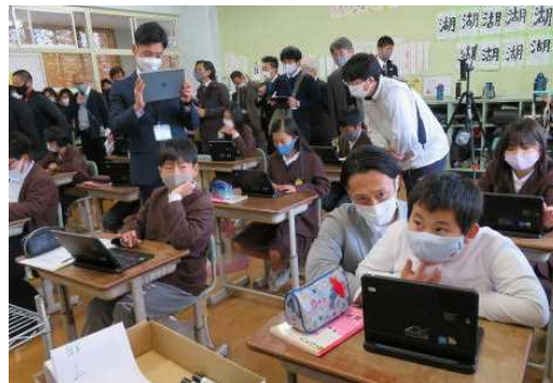
一人一台タブレット研究授業11月23日

そんな時代に生きる子どもたちに必要な 資質・能力 を見通した教育がこれからますます必要となります。AI社会であるからこそ、学びに向かう 人間性 の育成、 多様性 を受け容れる 寛容性 の醸成、世界の人とつながる 協調性 やコミュニケーション能力の育成などが重要になってくると考えます。小学校ではICT機器の利活用に努めながらも、例えば、リコーダー、毛筆、絵の具や陶芸、人とのふれ合い体験などの機会をできるだけつくり、 仮想の世界 では味わえない 本物の世界 の中で進める良さを改めて大事にしながら、人間らしい豊かな心を育てていきたいと思ひます。子供たちがよりよい 未来の創造者 になってほしいと思ひます。