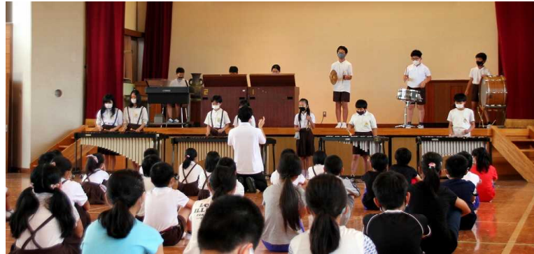
合奏を全校朝会で発表する6年生

本校校区はもともと豊かな自然環境の中ですので、子供たちは様々な体験を生活の中でできていることと思いますが、この臨海学校で行く海辺は、自然がそのまま残る豊かな場所です。 磯の香り を感じ、すきとおった 海の中 にいる生き物も見ることが出来ます。水族館では 感じる ことが出来ないような 自然の営みに感動 を味わうこともできるでしょう。 貴重な経験 から何かを感じ、そしてしっかり学んで成長してほしいと願っています。