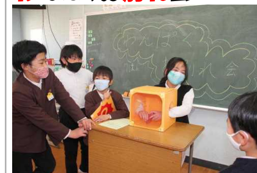
わんぱく班で楽しい時間を過ごしました